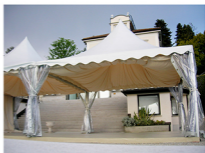
Esempio di allestimento