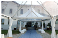
Esempio di allestimento